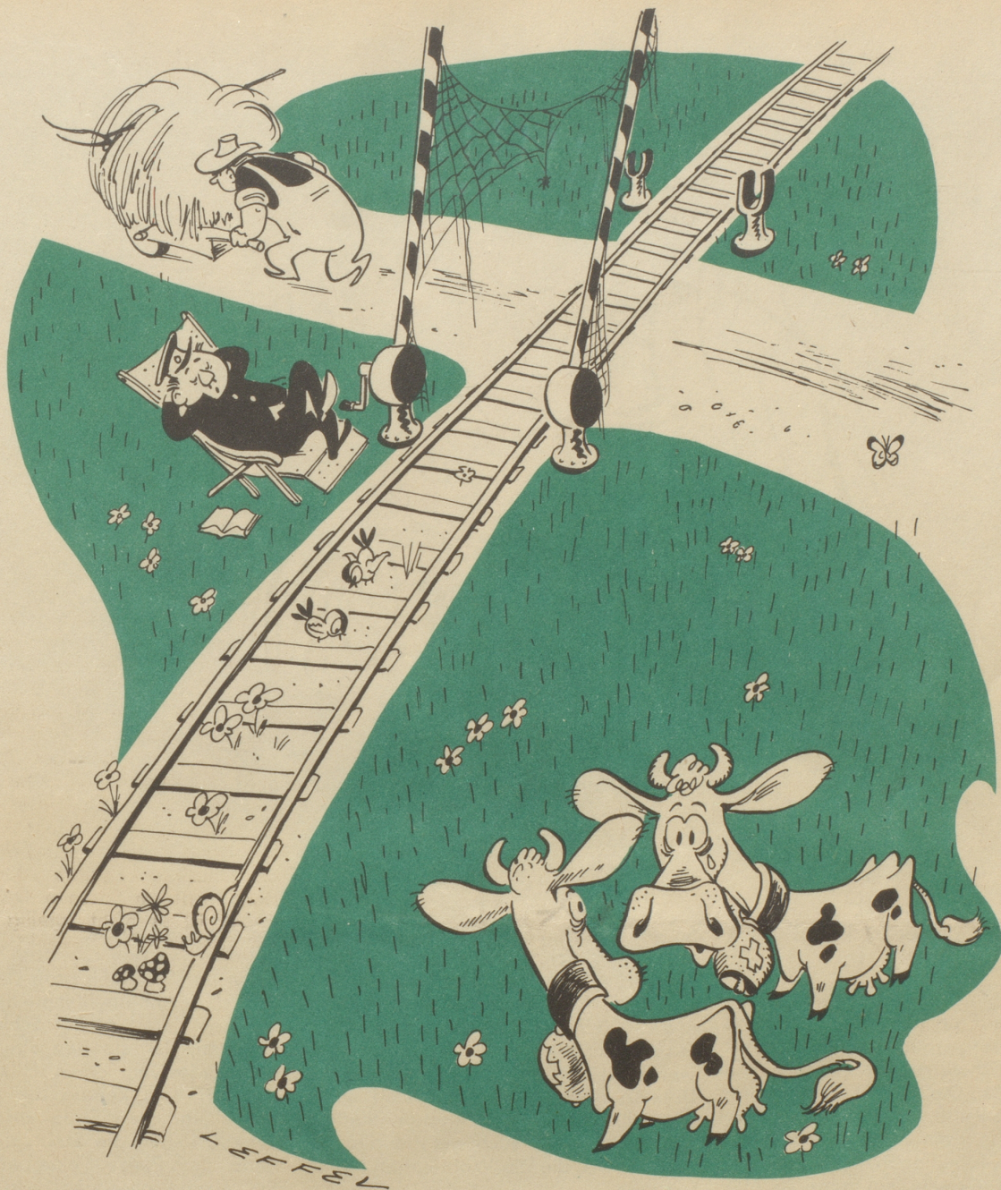
Einschränkungen im Eisenbahnverkehr

„Etz törfed mir glaubi wider ufs Gleis go fresse!“