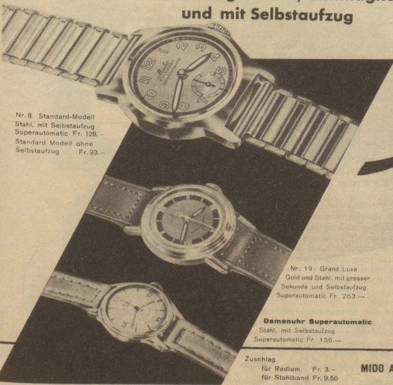
Nr. 8 Standard-Modell Stahl, mit Selbstaufzug Superautomatic Fr. 128.- Standard Modell ohne Selbstaufzug Fr. 93.-

Wir denken an den Alltag und wählen die Uhr, welche auch den härtesten Anforderungen standhält: 100% wasserdicht, stoßgesichert, antimagnetisch und mit Selbstaufzug