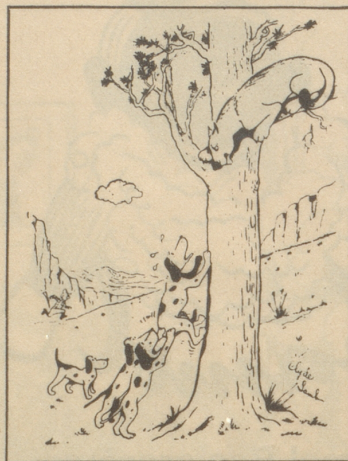
Neue Wege zeigen Field & Stream, Oktober 1946