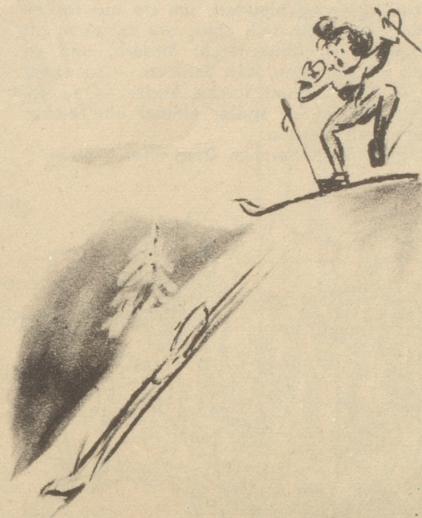
Es Schneebrett hat sich glöst!

«Mister Jean, es steht fest für mich, daß es nicht gerade der glücklichste