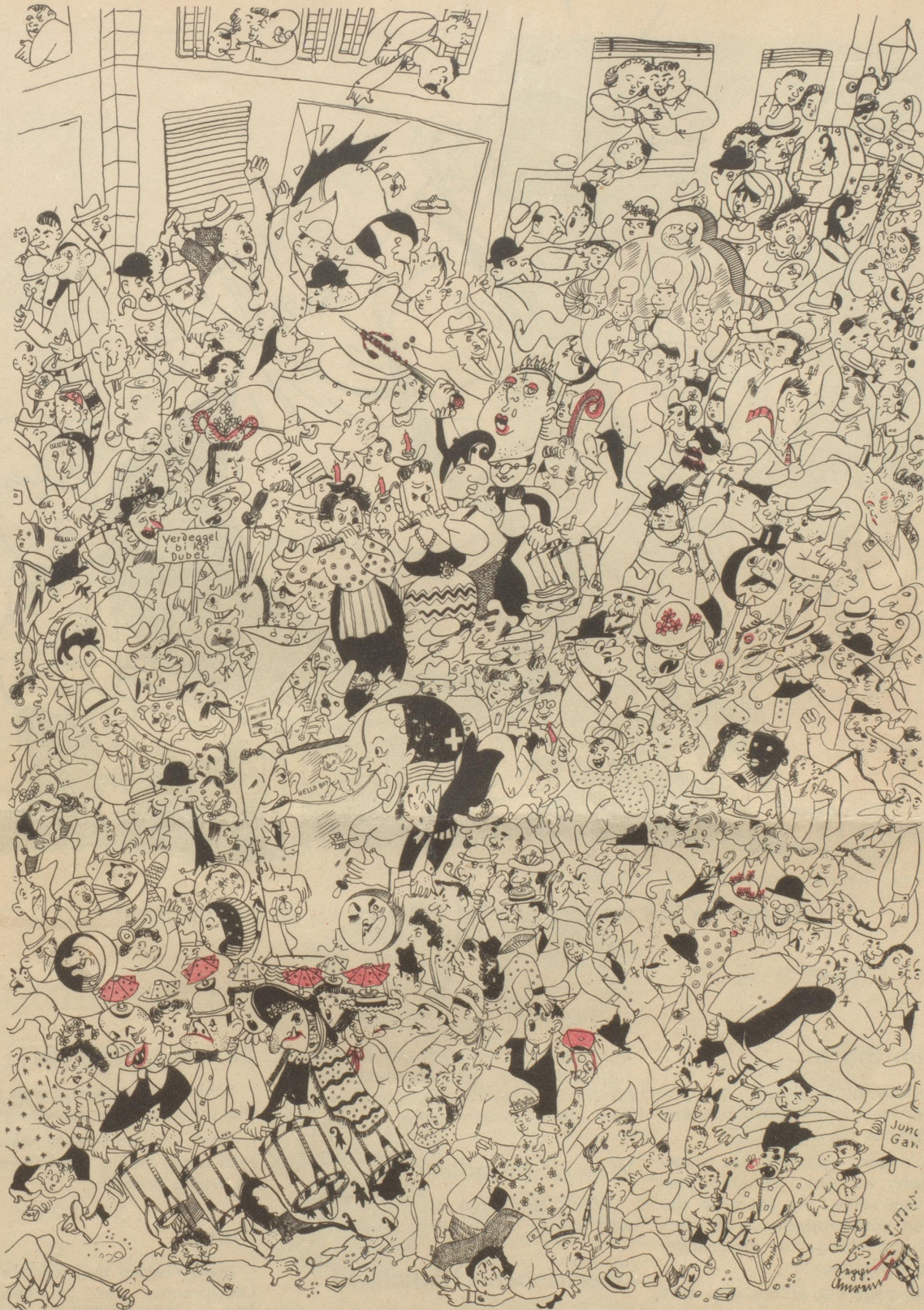
Der Luzerner Fastnächter Seppi Amrein erlebt die Basler Fasnacht