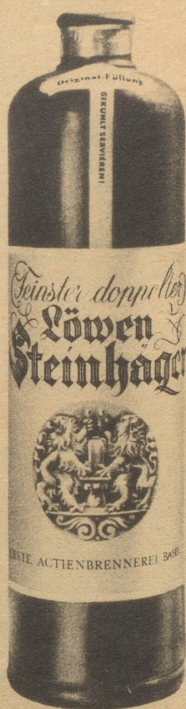
Erste Aktienbrennerei Basel