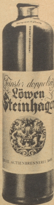
Erste Aktienbrennerei Basel