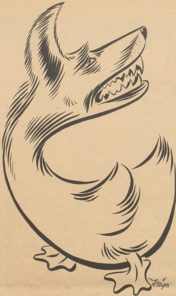
Die Walliser Zeitungsente ist vom Luchs über den Panther zur Löwin doch noch ein Wolf geworden