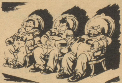
Von links nach rechts: