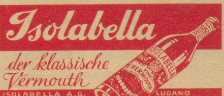
(Aus «Il Travaso»)