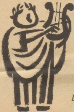
Die nächtliche Toga

Der Mann im Nachthemd! Sein Anblick erinnert ein wenig an den Römer in der Toga. Wie sich dieses stolze Kleidungsstück aber über- lebt hat, so ist nun auch das männliche Nachthemd im Begriff, sich als unzeit- gemäß zu überleben.