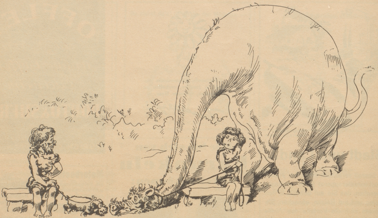
Zeichnung von R. Hoegfeldt