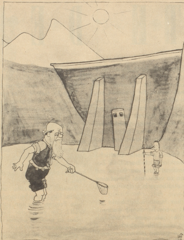
Erfolgreiche Erforschung der Bodenbeschaffenheit schweizerischer Stauseen im Herbst 1947

Arbon, Basel, Chur, Frauenfeld, St. Gallen, Glarus, Herisau, Luzern, Olten, Romanshorn, Schaffhausen, Sions, Winterthur, Wohlten, Zug, Zürich. — Depots in Bern, Biel, La Chaux-de-Fonds, Interlaken, Thun