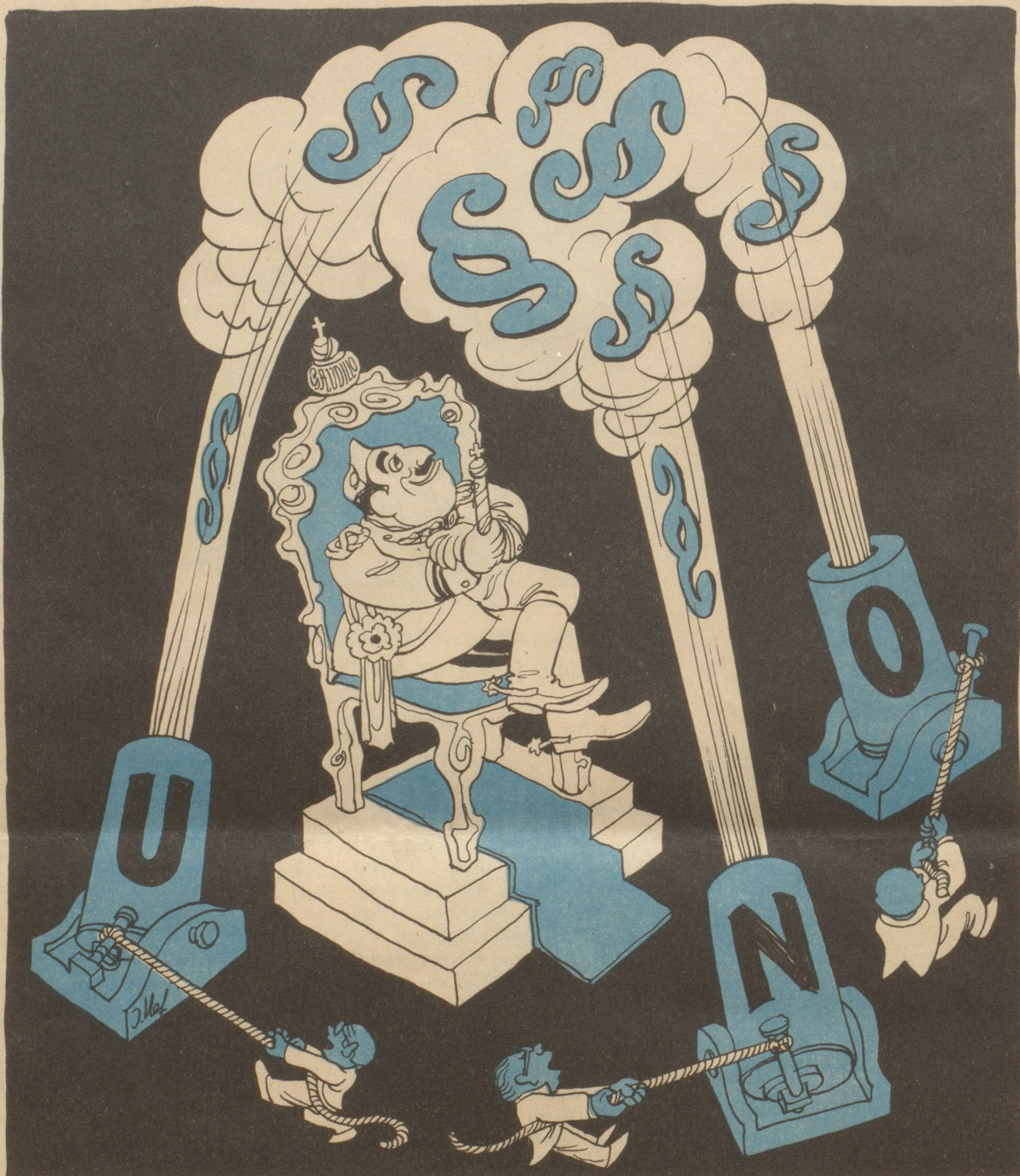
Zu den Beschlüssen der Uno gegen Franco

Hooo — — rutsch! Jetzt wird scharf gschosse!!