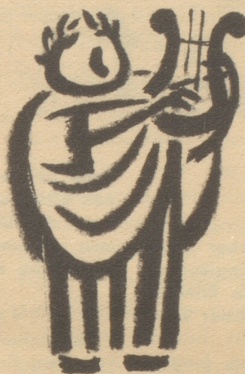
Die nächtliche Toga

Beachten Sie den großen UNIC-Wettbewerb der ELECTRAS BERN, Marktgasse 42