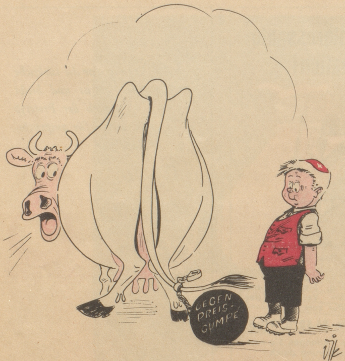
Fessle schtatt Ballönli!