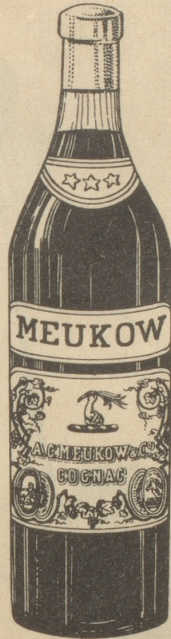
Agence générale pour la Suisse E. A. HUG. ZÜRICH 1 Münstergasse 4. Tel. 32 87 16