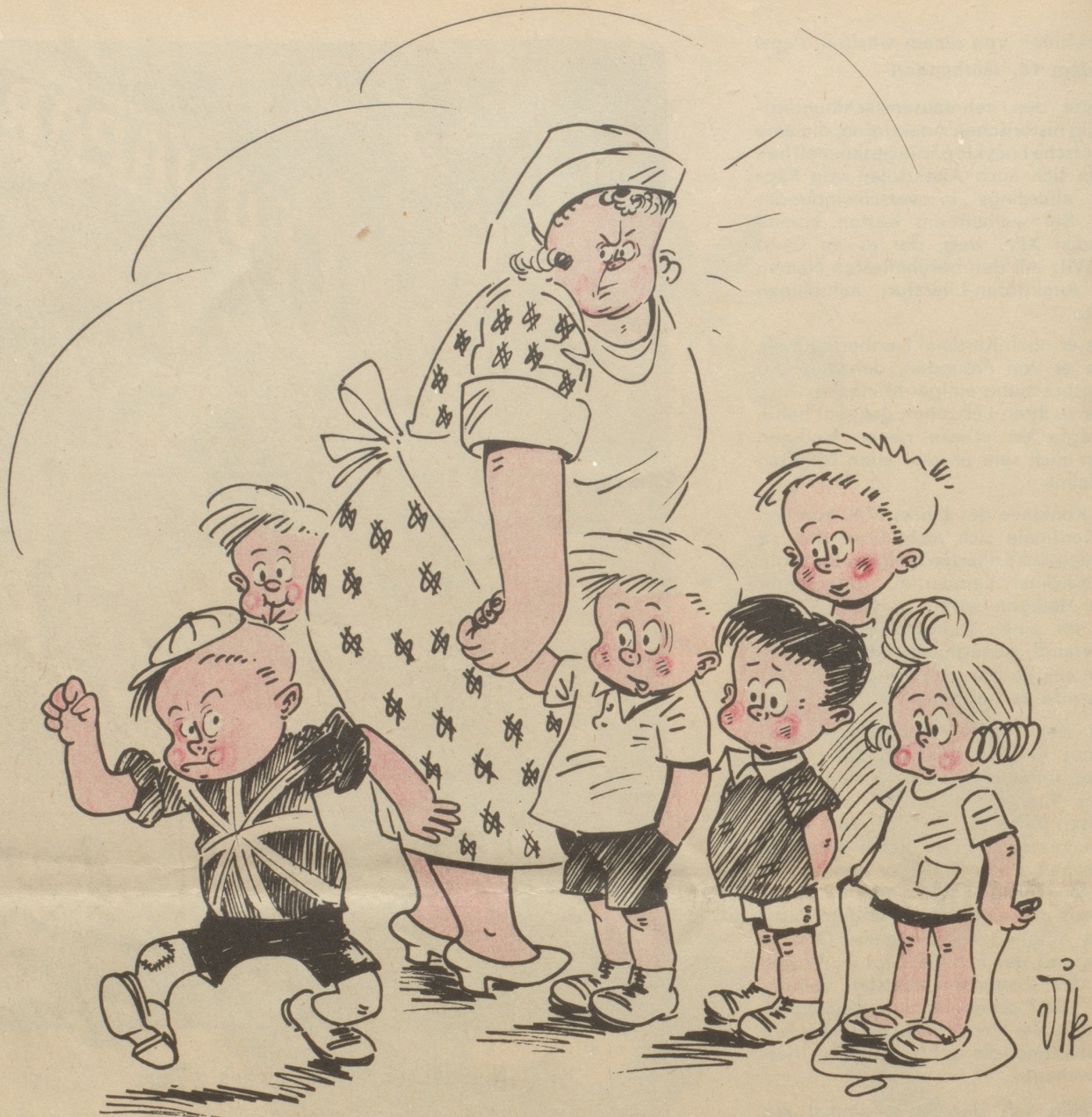
Der kleine John will sich von der Dollartante unabhängig machen!