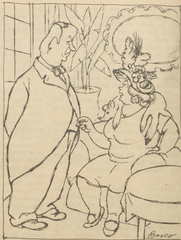
„Ihre Herr Brüeder sig schiints Mitglied vo dr P.d.A. worde?“ „Ja — aber wüssezi min Maa und ich lönd en jetzig links ligge!“