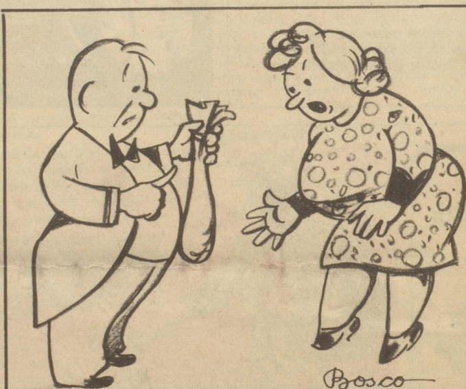
Was übrig bleibt für den Lebensunterhalt