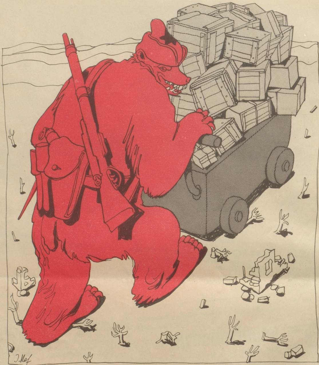
Rückzug der Russen aus Deutschland

Und nun mögen sie die Sowjetzone internationalisieren!