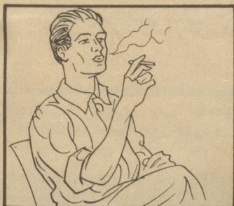
Rauchen Sie eine Marocaine Filter.