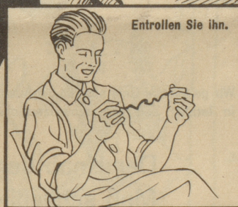
Entrollen Sie ihn.