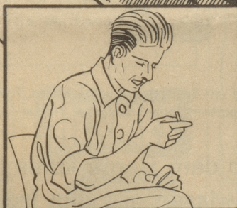
Der Filter ist dunkelbraun geworden.