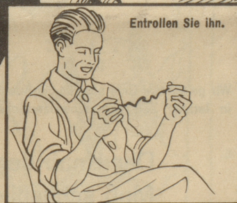
Entrollen Sie ihn.