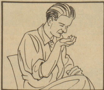
Riechen Sie daran.