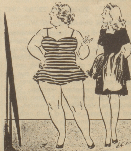
„Findet Sie nüd Schtreife mached dick?“ Tyrihans, Oslo

Eines war aber doch betrübend: während dieses Herumrennens hatte ich den anderen Schuh, den ich immer in Papier eingewickelt mit mir herum-schleppte, irgendwo liegen lassen, — leider nicht im Tram! Wo sollte denn der gesucht werden... Nun, ich besitze wenigstens den ersten, habe ihn aufs Buffet gestellt, um ihn immer vor Augen zu haben, und sehe ich ihn an, so wird mir jedesmal leicht ums Herz: «Solch einen gut funktionierenden Apparat, wie das Tram-Fundbüro, gibt es sicher doch nur in unserem fortschrittlichen Sowjet-Land!» (übers. v. O. F.)