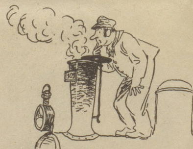
Aus „Dampfproßromantik am Gotthard“ von Paul Winter, illustriert von H. Laubi (Schweizer Spiegel Verlag Zürich)

Trotz gelobtem Schweigen ist diese Märe durchgesickert. Ein jeder hüte sich jedoch, ich rate es ihm, den Fer- rari zu fragen: «Wie weit ist es von Faido nach Airolo?» O du mon Dieu!