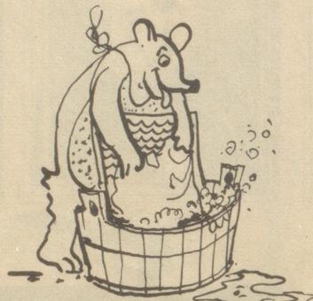
der Wasch Bär