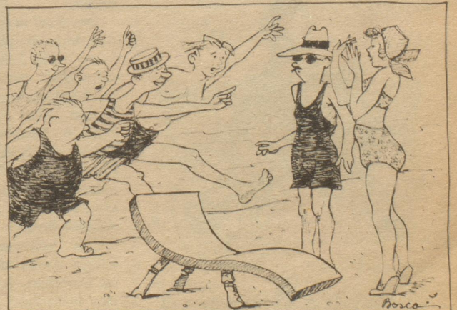
„ . . . isch zuiefelig under dene Here en Tokter? “