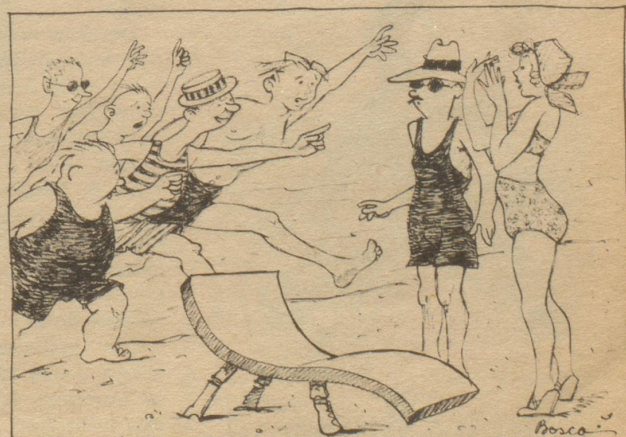
... isch zuiefelig under dene Here en Tokter? ..