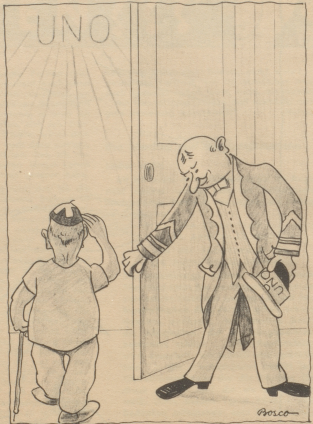
„Das freut is aber daß Sie chömed!“