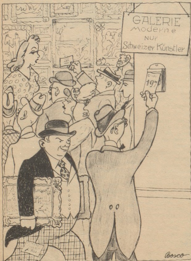
In den Kunsthandlungen: „Dra-cho-Nummerli“