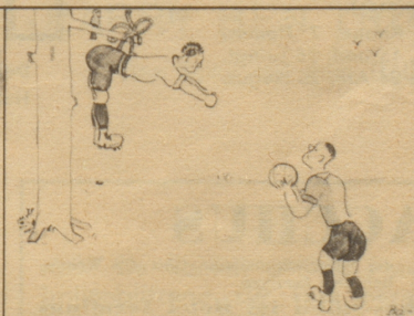
Oberer gibt an Sutter, der weit vorne hängt

Ein Laie illustriert eine Cup-Final-Reportage