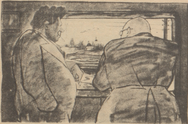
Mensch und Natur