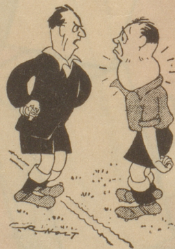
«Das kommt davon, daß du immer mit offenem Munde herumrennst!» («Manchester Evening News».)

Also sind mir diejenigen, die Neujahrskarten schreiben, lieb, auch wenn Sie mir mit der Beantwortung ihrer Karten über diese Feiertage Mühe machen. Ehre und ewigen Fortbestand der Neujahrskarte!