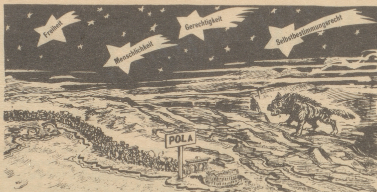
Pola, der jugoslawisch-italienisch-britisch-russisch-amerikanische Zankapfel