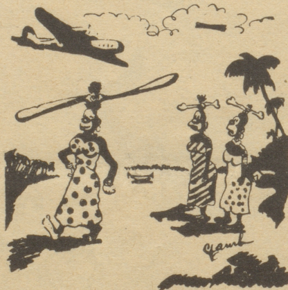
Die Wohlfahrt der Zivilisation.