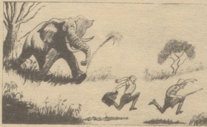
Der Photograph: «W-w-was hescht gseit?» Der Jäger: «I ha-ha gseit — g-g-gemmer üs lieber mit dem do nüd ab.» Life