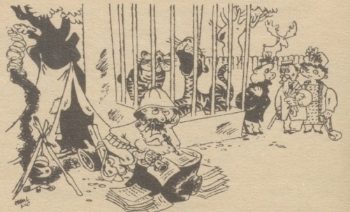
Der Schriftsteller, der im Zoo die Atmosphäre des Dschungels spürt.