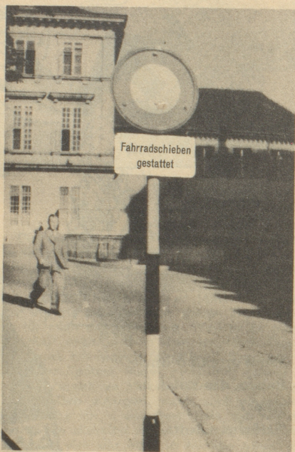
Großzügigkeit ist eine Zier, der Basler treibt Exzeß mit ihr! Ein Zürcher.