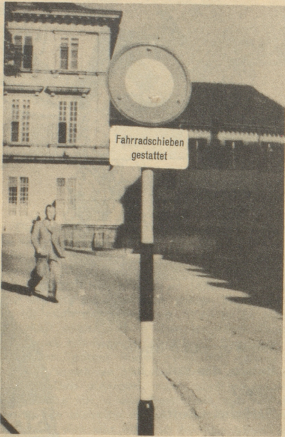
Großzügigkeit ist eine Zier, der Basler treibt Exzeß mit ihr! Ein Zürcher.