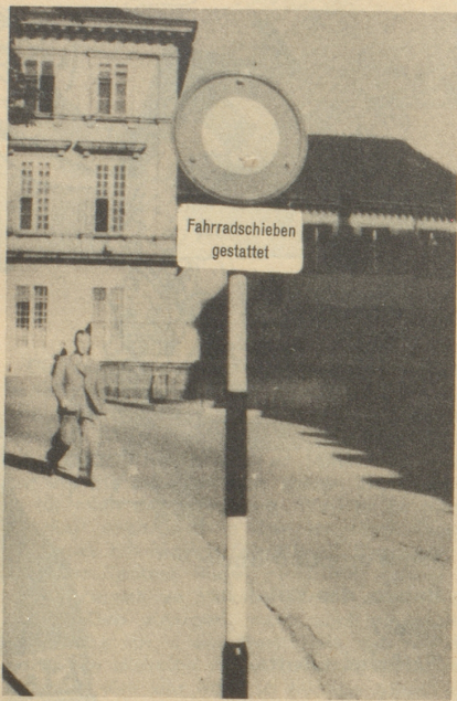
Großzügigkeit ist eine Zier, der Basler treibt Exzeß mit ihr! Ein Zürcher.