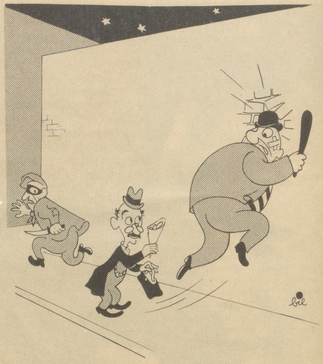
Künftiges Paris bei Nacht Atombomben gefällig?