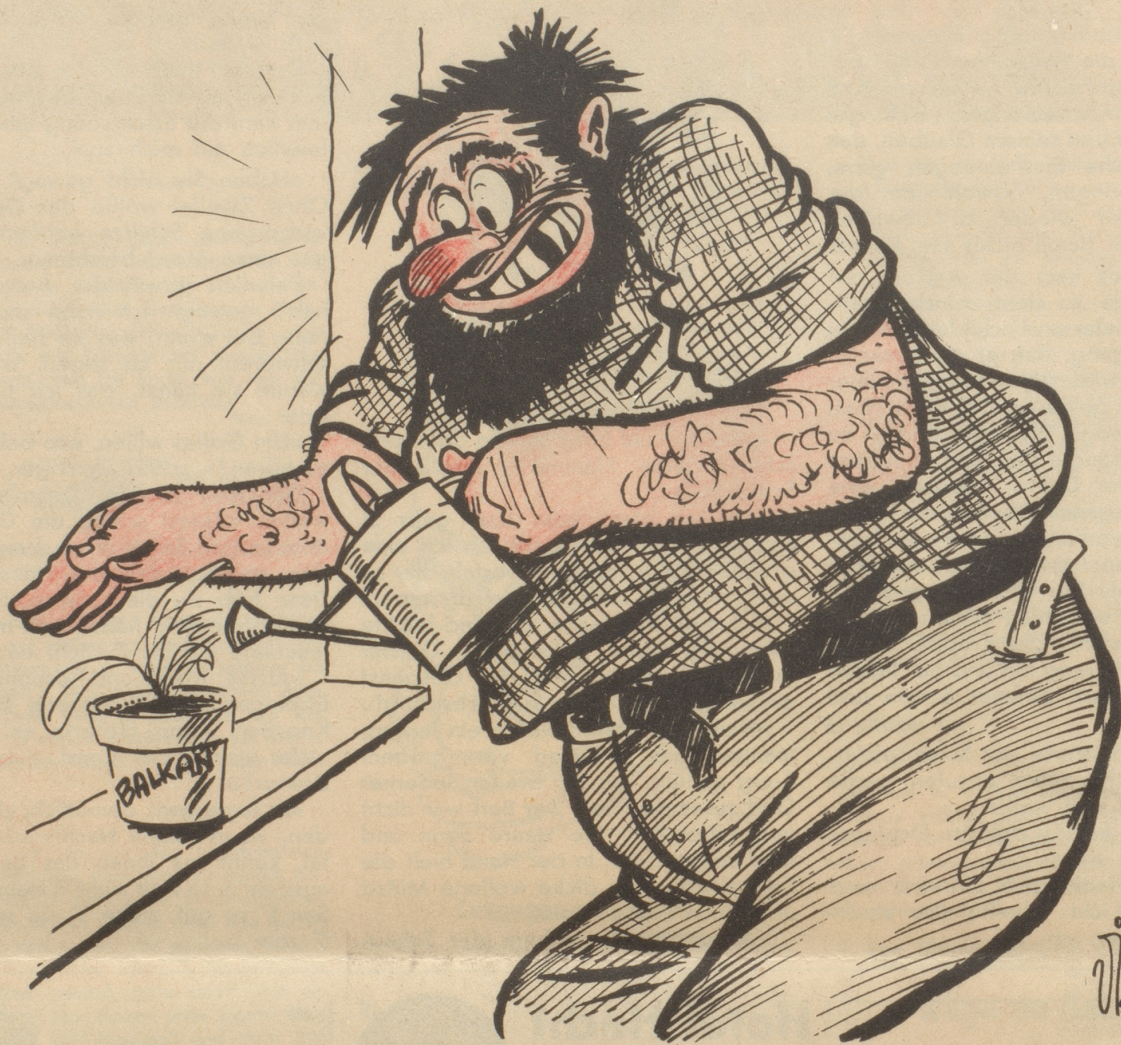
Mars begießt sein Lieblingspflänzchen