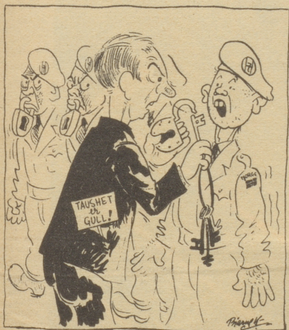
In Norwegen verabreicht man den Heilgenossen eine Medaille! Tyrhans, Oslo