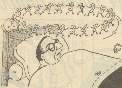
Brefonischer Tanz Le Canard enchaîné