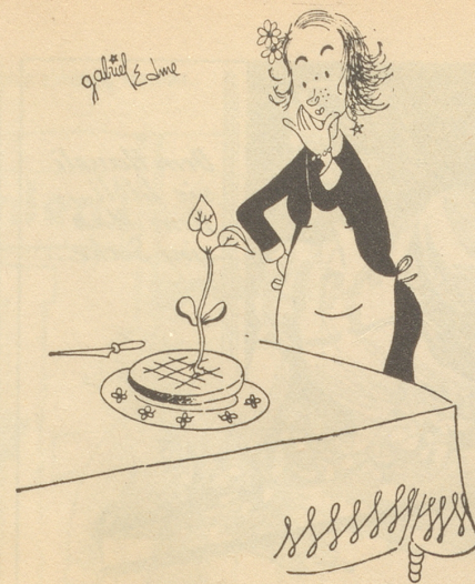
«Ich hätte doch keine Bohne in den Kuchen hineintun sollen.» Paysage-dimanche