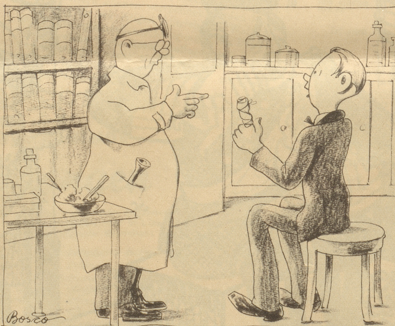
Morgen: „Ihren Schpiise will ich Ihne scho useoperiere — aber nu wänn Sie au de Blinddarm lönd la usenä.“

Vor kurzem fand in Chur eine großaufgezogene Versammlung der Linksparteien statt, an welcher durch den Hauptreferenten wegen der «Säuberungsaktion» wacker gegen die Bundesbehörden losgezogen wurde. Als