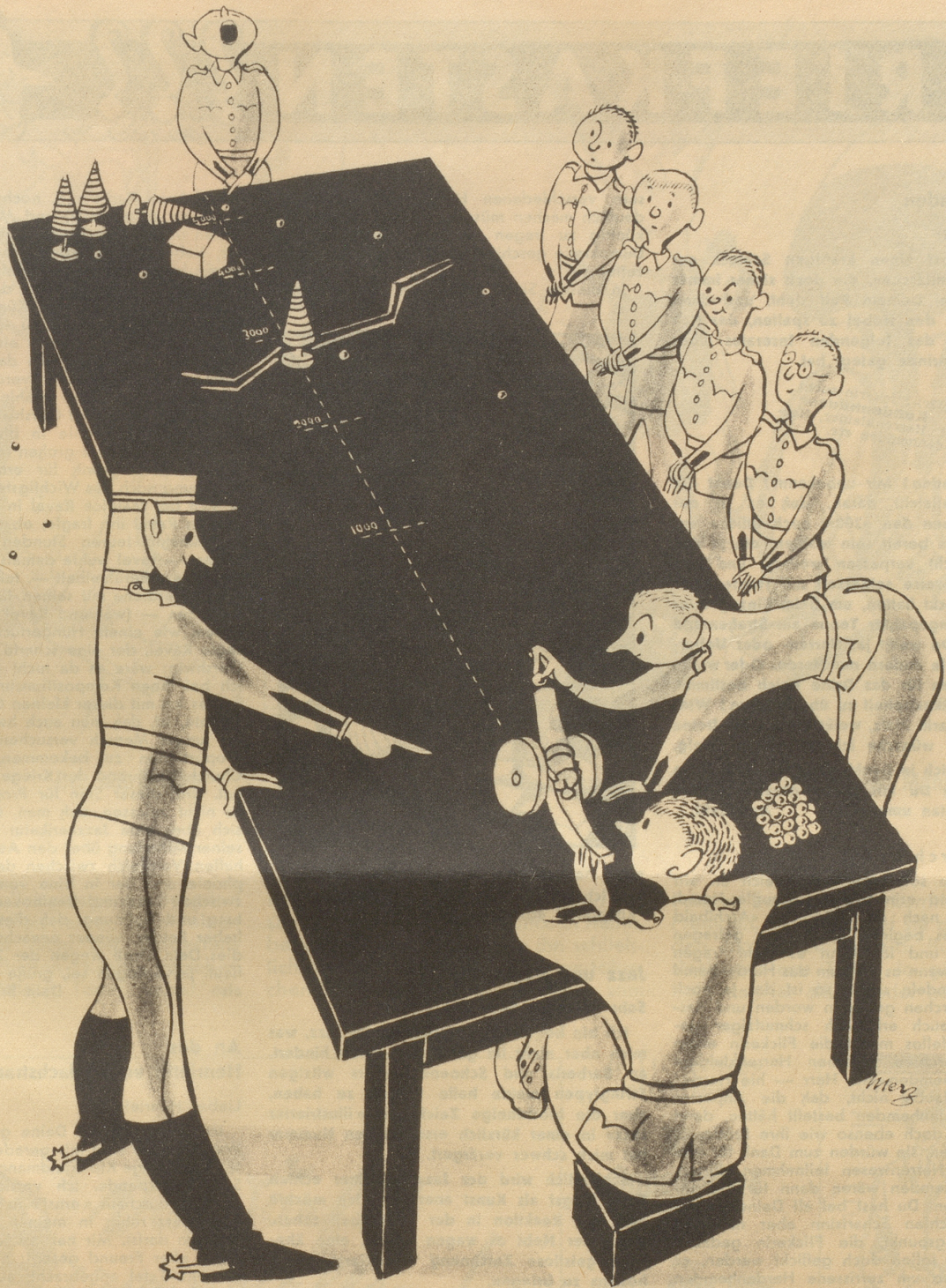
Zur Opposition gegen die Erweiterung der Artillerie-Schießplätze