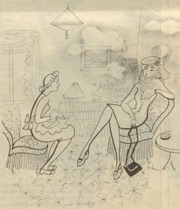
Die neue Hausgehilfin