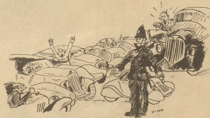
Die Saison beginnt!

«Entschuldiget, ich han i dene Jahre au verschiedenes vergässe ....»