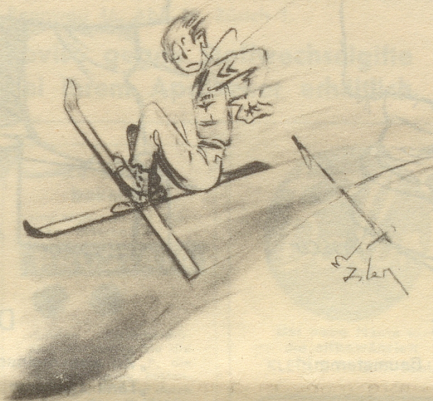
R. A. F.-Flieger bei uns

Je größer das Einkommen, desto besser die Versorgung. — Wahrhaftig, ohne die Hilfe der Medizinischen Wochenschrift wäre kein Mensch auf diesen Gedanken gekommen! Grüß! Nebel.