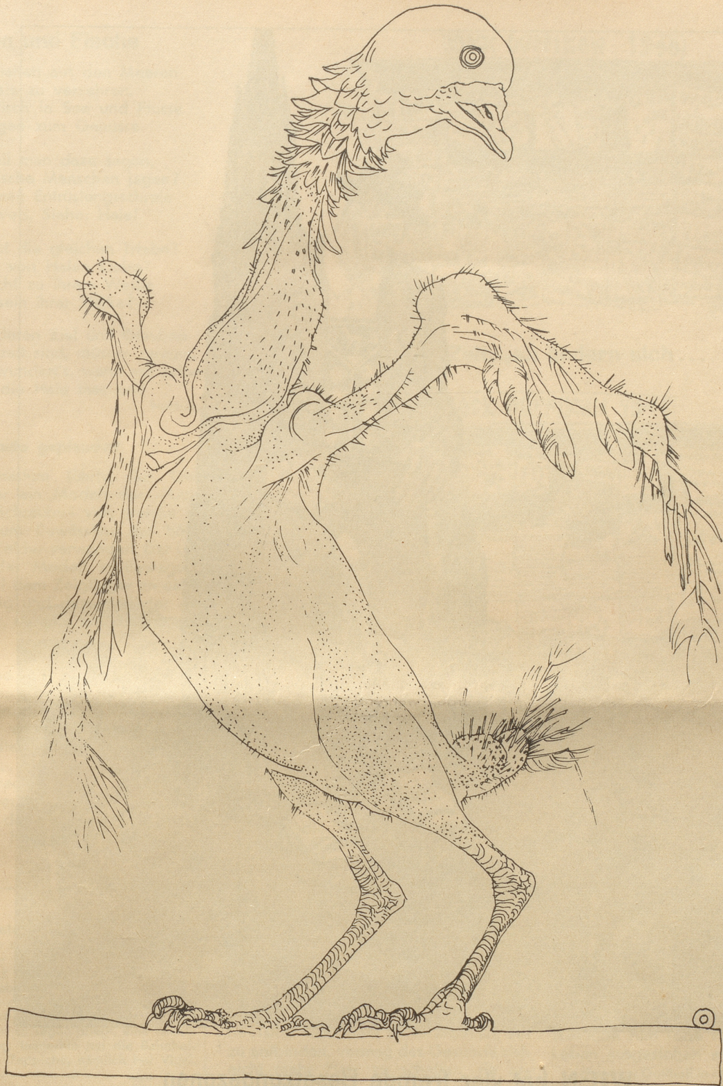
Die Friedenstaube nach einjähriger Behandlung