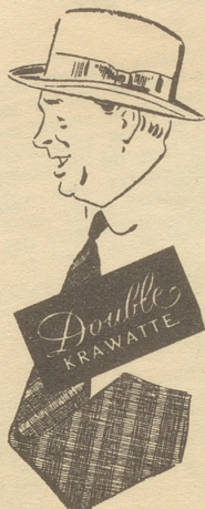
doppelseitig tragbar ... doppelt haltbar.

Lassen Sie sich die prachtvollen neuen Muster zeigen. Double-Krawatten sind in den guten Geschäften erhältlich.