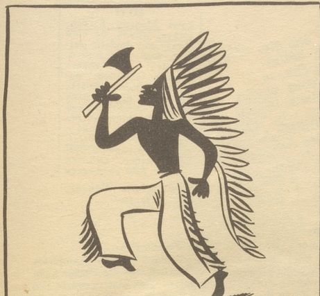
Der Sioux-Häuptling ist voll Mut,