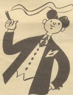
Der Sioux-Stumpen duftet gut!