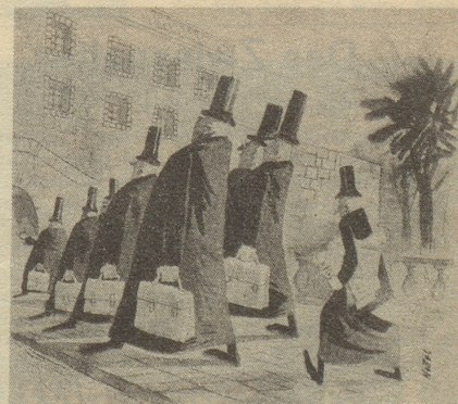
Der Minister ohne Portefeuille

Natürlich, es gibt ja auch zwei Kategorien Spender: solche, die gaben, was sie konnten, und solche, die nicht ganz so viel gaben.