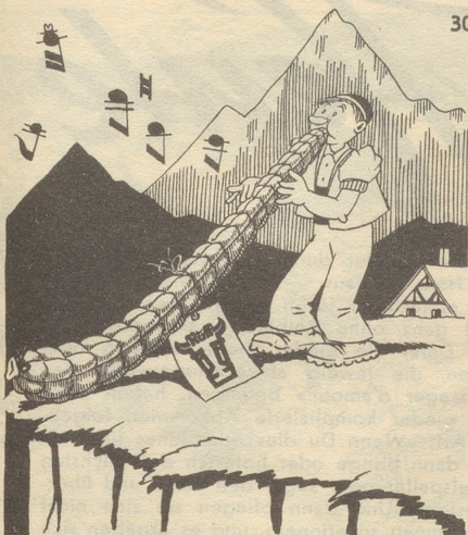
Ein bäumiger Alphornbläser

Firma OTTO RUFF Zürich Inh.: Rolf P. Ruff Fabrikation feiner Fleisch- und Wurstwaren