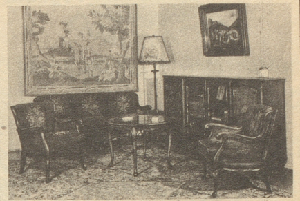
Einrichtungen in alten Stilarten Einzelanfertigungen und Kleinmöbel

Rohr A. D. Zürich, Stilmöbel. Fraumünstler 23.