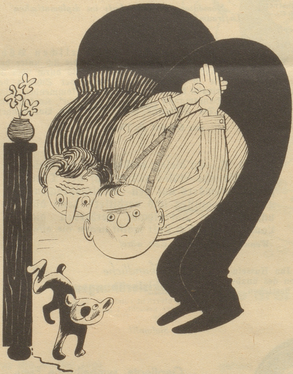
„Aber Herr Merz was gezeichnet Sie da?! Das macht üsen Filax nie!“