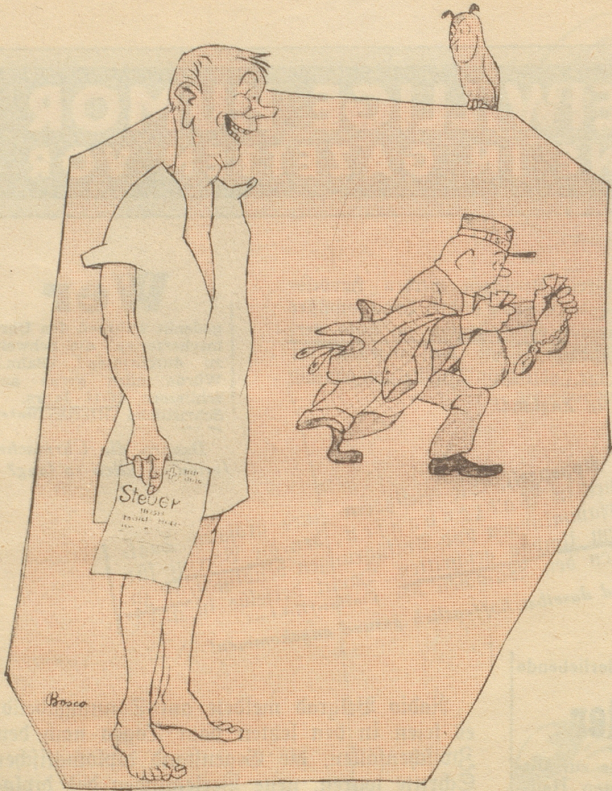
Humor ist, wenn man trotzdem lacht!