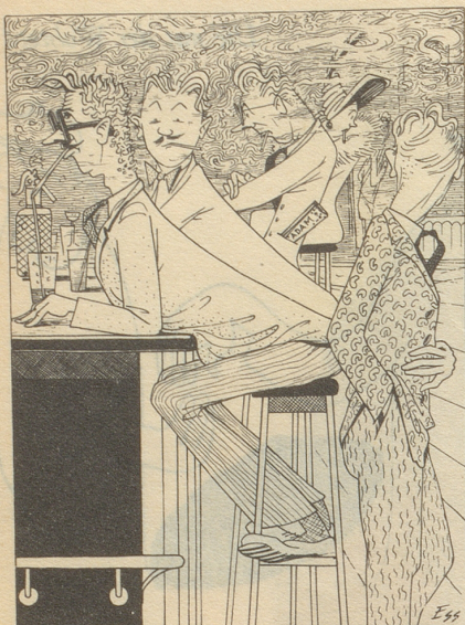
Leute mit BAR-Geld